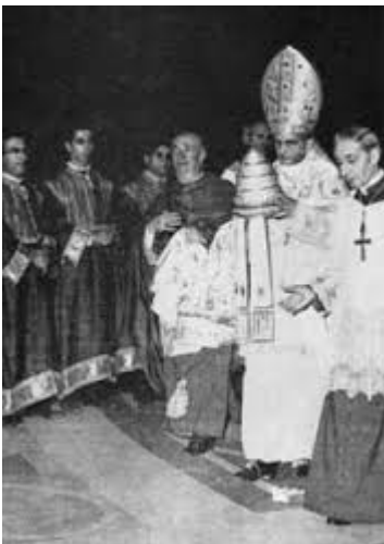
Paul 6 donne la tiare papale à l'O.N.U.

78. Cette collaboration internationale à vocation mondiale requiert des institutions qui la préparent, la coordonnent et la régissent, jusqu'à constituer un ordre universellement reconnu. De tout coeur, Nous encourageons les organisations qui ont pris en main cette collaboration au développement, et souhaitons que leur autorité s'accroisse. "Votre vocation, disions-Nous aux représentants des Nations unies à New York , est de faire fraterniser, non pas quelques-uns des peuples, mais tous les peuples [...]. Qui ne voit la nécessité d'arriver ainsi progressivement à instaurer une autorité mondiale en mesure d'agir efficacement sur le plan juridique et politique ?"(A. A. S., 57, 1965, p. 880.).