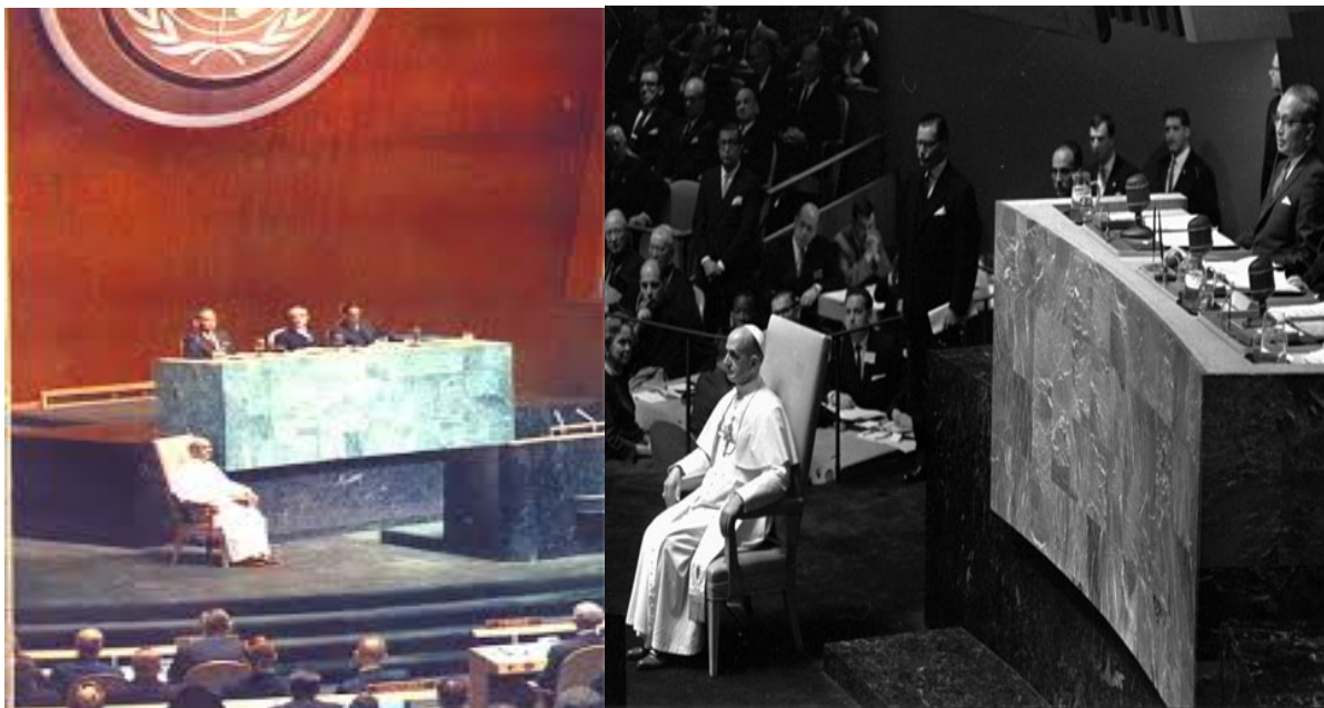
Photo : L'Antipape Paul 6 à l'ONU, le fief mondial maçonnique.

Ce feuillet énonce les preuves irréfutables permettant d'établir que Giovanni Battista Montin, l'antipape Paul VI, n'a jamais été Pape de l'Eglise catholique. De nombreuses preuves permettent d'établir ce fait, ainsi il sera tout d'abord donné quelques preuves en résumé. Ceux qui souhaitent se documenter plus profondément sur la question, peuvent lire ce feuillet en entier.